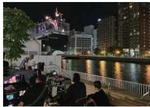
ロケ地:水上公園 (福岡市中央区)

平成28年7月に誕生した新たなランドマーク。屋上デッキの先端部には様々なアクティビティを誘発する仕掛けがあり、「タイタニックごっこ」を推奨する看板も。浴衣姿の市民エキストラ会員の皆さんに参加いただき、京がどん子に告白するクライマックスシーンの撮影が行われました!