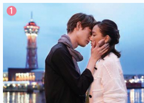
ロケ地:博多ふ頭(びあトピア緑地) (福岡市博多区)

6月初旬の撮影。雨天で遠雷が聞こえても、ここだけは晴れていたという奇跡のシーン。夏場は日の入りが遅いため関係施設に営業終了後も点灯をお願いして煌々中で撮影。日没までの光の変化が幻想的でした。