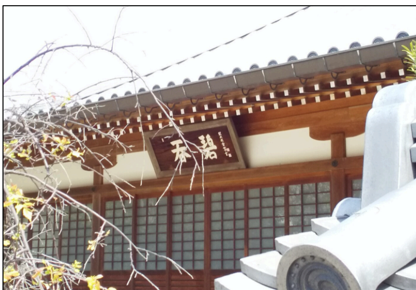
妙楽寺本堂とういろいろ伝来之地碑