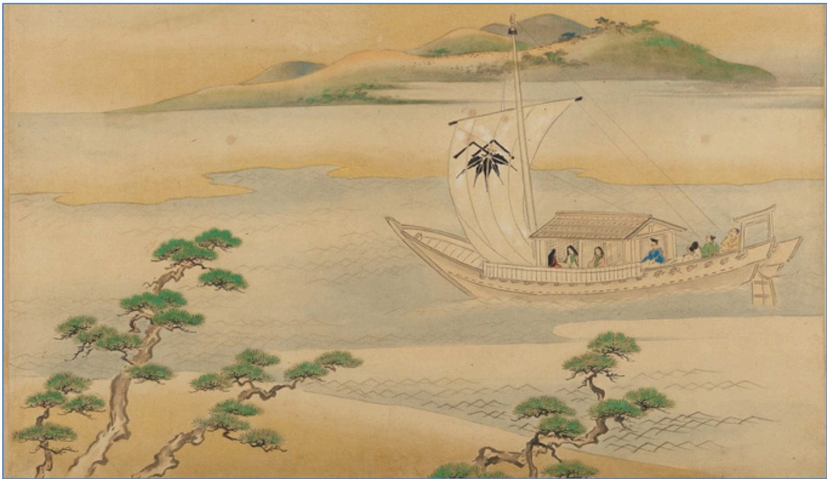
筑前へ下る船中の玉鬘／伝海北友雪筆『源氏物語』絵巻「玉鬘」（メトロポリタン美術館）

NHK で放映中の大河ドラマ「光の君へ」主人公の紫式部をはじめ、登場する人々と筑前・福岡とのかかわり。また、『源氏物語』中に紫式部が語りする筑前・福岡をご紹介します。教室の後は、復元した『源氏物語』柏木に出てくる菓子「粉熟」で煎茶をいただきます。