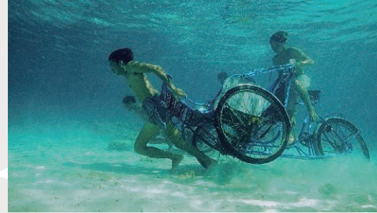
ジュン・グエン＝ハツシバ [日本/アメリカ/ベトナム] 《メモリアル・プロジェクト ナ・トラン、ベトナム - 複雑さへー 勇気ある者、好奇心のある者、そして臆病者のために》2001年、熊本市現代美術館蔵 Jun Nguyen-Hatsushiba [Japan / US / Vietnam] Memorial Project Nha Trang, Vietnam: Towards the Complex - For the Courageous, the Curious, and the Cowards. 2001, Collection: Contemporary Art Museum, Kumamoto, Courtesy: the Artist/ Mizuma Art Gallery, Tokyo, Commissioned by Yokohama Triennale 2001

アーティスト 8 名によって表現された「水」をめぐる多彩な作品を体感していただくことで、アジアの現代アートに触れる一歩となれば幸いです。