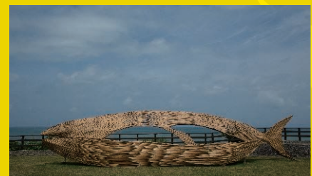
安聖恵 [台湾] 《そこにある海》2018年、台湾東海岸大地藝術館所蔵 ※参考作品 Eleng Luluan [Taiwan] The Sea Over There , 2018, Collection of the TECLandArts Festival

ボートレース福岡の芝生広場では台湾の美術作家・安聖恵による風が吹き抜ける魚のベンチを置き、訪れる皆さまに憩いの場を提供します。