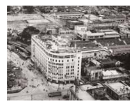
昭和26年当時の天神(岩田屋付近) ('都心界50年のあゆみ記念誌'より抜粋)