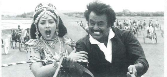
©1995/2018 KAVITHALAYAA PRODUCTIONS PVT LTD. & EDEN ENTERTAINMENT INC. 監督: K. S. ラヴィクマール 出演: ラジニカント ミーナ 1995年/デジタル/カラー/166分/インド/日本語字幕付き