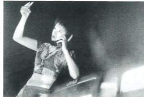
監督: ホー・ビン 出演: 伊能静 チャン・シー 1997年/35ミリ/カラー/123分/台湾 日本語・英語字幕付き

午後6時、突然台北の高速道路が閉鎖され、大渋滞となる。政治家を殺した男はバスジャックして逃げる。仕事の不満から職場を放棄したローは、車で彼女に会いに行く。少女のジェイドは遊びで車を盗んで乗り回す。3人の登場人物の一夜の物語で、3人の物語が交互に語られていく。島を環状にめぐる台湾の高速道路に、現代台湾の社会状況が投影される。