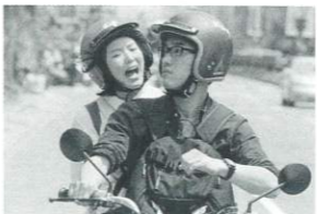
監督: シエ・チュンイー 出演: チャン・シューハオ ホアン・ルー 2013年/デジタル/カラー/90分/台湾 日本語・英語字幕付き

公務員のアーチェンは大陸と台湾の文化の違いを説明する冊子の制作担当だが、大陸の事が分らず苦勞していた。ある日彼は大陸から来たチン・ランと知り合い冊子作りに協力してもらう。本作は監督が台湾と大陸との文化の違いを経験したことからの着想したもの。二人の関わりの中に両国の複雑な歴史が透けて見える。