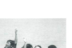
監督: ホウ・シャオシェン 出演: トニー・レオン 羽田美智子 1998年/35ミリ/カラー/121分 台湾=日本/日本語字幕付き

19世紀末。上海の英国租界にある遊郭。高級官僚のワンは遊女のシャオホンと出会い熱烈な恋愛をする。ワンはシャオホンを身請けしたいと思うのだが、シャオホンはなかなか承諾しない。映画に登場するのは3組のカップルであり、微妙な恋模様を描かれる。映画の舞台は遊郭の中に限定され官能的な雰囲気を出す。ホウ・シャオシェン監督の映画芸術の極致のような作品。