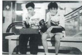
監督: チェン・ユーシェン 出演: ウェイ・イン リン・チェンシェン 1995年/35ミリ/カラー/109分/台湾 日本語・英語字幕付き

リョウ・ツーチャンは中学3年生で、受験を控えていた。ある日偶然ツーチャンは誘拐されてしまう。ところが誘拐犯のボスが死亡し、困った手下のアチンはツーチャンを自分の田舎に連れていく。チェン・ユーシェン監督のデビュー作。「熱帯魚」のシナリオが最優秀シナリオに選出されたことで映画化された。とぼけた味わいのナンセンス・コメディである。