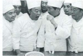
監督: アン・リー 出演: ロン・シヨン ウー・チェンリエン 1994年/35ミリ/カラー/124分/台湾 日本語・英語字幕付き

高級ホテルのシェフだったチウは、妻を亡くし男手一つで娘3人を育てた。娘3人は独身で適齢期を迎えていた。ある日隣に未亡人が越してきて、チウの家にもよく訪れるようになる。豪華な料理から家庭料理まで、様々な中華料理が登場するグルメ映画であり、父親と娘3人をめぐる恋愛コメディでもある。監督は「シェフがご馳走を作るように、この映画を作った」と語る。