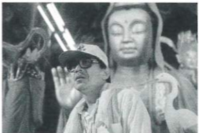
監督: チェン・シンイー 出演: ジャック・カオ トレイシー・スウ 2007年/35ミリ/カラー/119分/台湾 日本語・英語字幕付き

台北で暮らすチンは出産するが、次第に情緒不安定になる。そして赤ん坊が突然死する。民芸品を売るブヨンは酒癖が悪く、娘のサビイは家出してキックボクシングの選手を目指す。牛角はトラックに仏像を乗せて各地の祭礼をめぐる仕事をしていく。3組の異なる登場人物の物語だが、彼らは映画の中ですれ違うが深く知り合うことはない。現代社会の縮図のような作品。