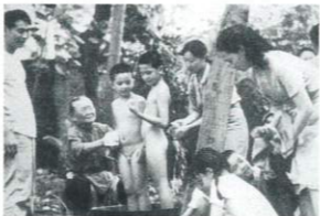
監督: ワン・トン 出演: タオ・スー シー・チュン 1996年/35ミリ/カラー/167分/台湾 日本語・英語字幕付き

ワン・トン監督の父親は国民党の将軍であり、1949年に大陸から台湾に渡ってきた。本作はワン・トン監督の自伝的要素が強い作品であり、映画に登場する祖母や兄弟はすべて監督の家族がモデルである。この映画は監督の祖母への追悼の物語であり、祖母を中心とした家族のドキュメンタリーのように物語は進行していく。50年代から60年代の台湾の風俗が詳しく描かれることも興味深い。