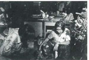
監督: レオン・ダイ 出演: チェン・ウエンビン チャオ・ヨウシェン 2009年/35ミリ/モノクロ/92分/台湾 日本語・英語字幕付き

台湾の高雄市。リー・ウーシェンは7歳の娘メイと暮らしていた。ある日警察が来て、メイを戸籍登録して学校に入れるように勧告する。メイには出生届が出されていないのだ。役所をたらいまわしにされるウーシェンは、養育権がないことを知らされる。映画は2003年に実際に起きた事件をもとにしている。本作は大ヒットとなり、戸籍のない子どもを救済する基金が設立された。