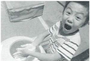
監督: リン・ユウシェン 2004年/35ミリ/カラー/84分/台湾 日本語・英語字幕付き

台湾東部の宜蘭県羅東鎮公正国民小学校の体操部に所属する子どもたちを描いたドキュメンタリー。子どもたちは6歳から8歳の7人の少年で、コーチをしているのは監督の兄のリン・ユウシン。子どもたちは辛く厳しい練習の中でも屈託のない笑顔を見せる。映画を見る者に夢見ることの大切さを伝えるさわやかな感動作。