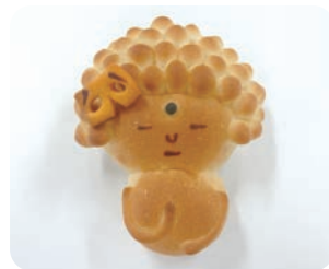
大仏パン (ばん屋のべったん)