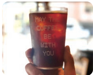
Jigoku Blend (MANU COFFEE)