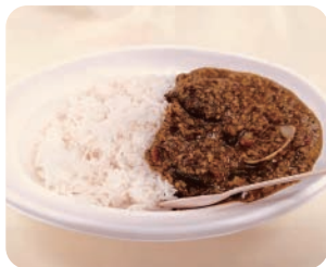
地獄カレー (スパイスロード)