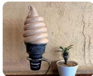
五重塔ソフト (春吉ソフト)