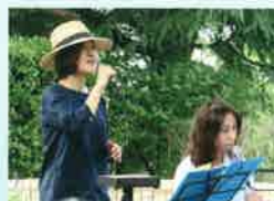
Jゴスペル Sweet incense