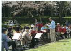
マンドリン演奏 福岡マンドリンオーケストラ