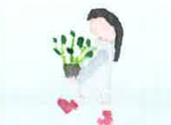
出演時刻は裏面を ご覧ください