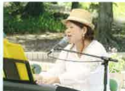
Jゴスペル Blessing rise