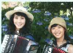
アコーディオン二重奏 コラソン・ディアマンテス