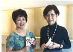
オカリナ演奏 レモンスカッシュ

花畑マルシェ10:00-16:00 ミニ演奏会(噴水広場) 11:30-14:30