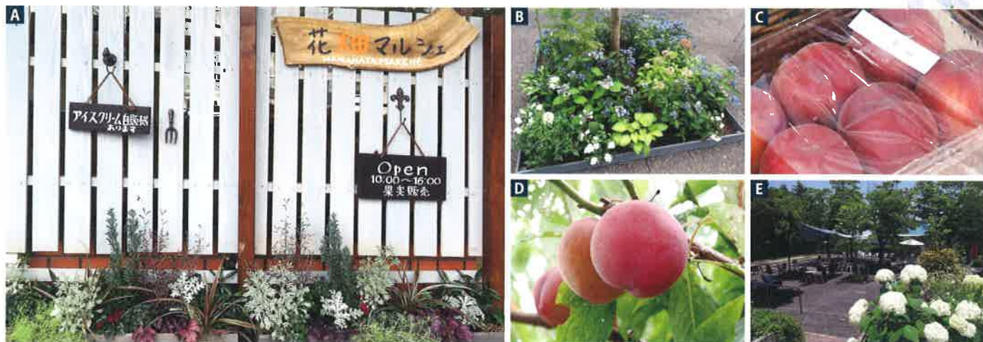
A 《花畑マルシェ》では園内で穫れた果実を販売 B 販売予定のアジサイ C D イベントで販売予定のすもも・桃 E 演奏会が開催される噴水広場