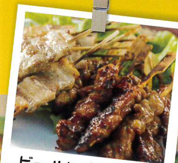
ビールには焼き鳥♪