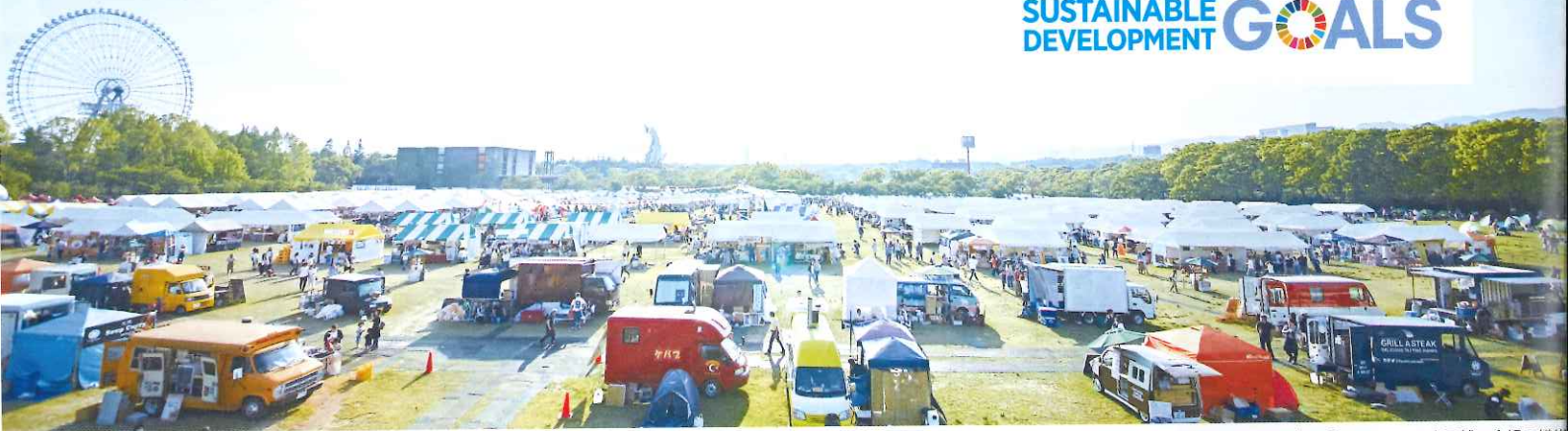
※写真は「ロハスフェスタ万博」会場の模様