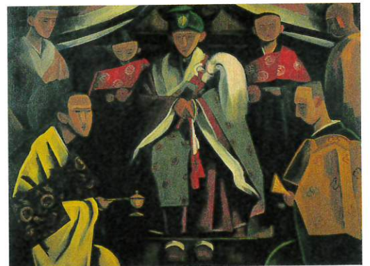
古賀春江《曲景につく》1923年 石橋財団ブリヂストン美術館蔵