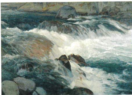
吉田博《奔流》1936年 石橋財団ブリヂストン美術館蔵