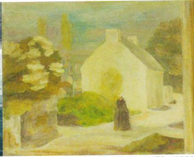
坂本繁二郎《ヴァヌア風景》1923年