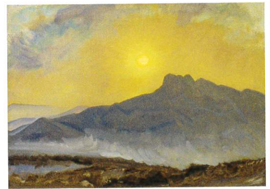
藤島武二《五剣山の日の出》1932年 石橋財団ブリヂストン美術館蔵