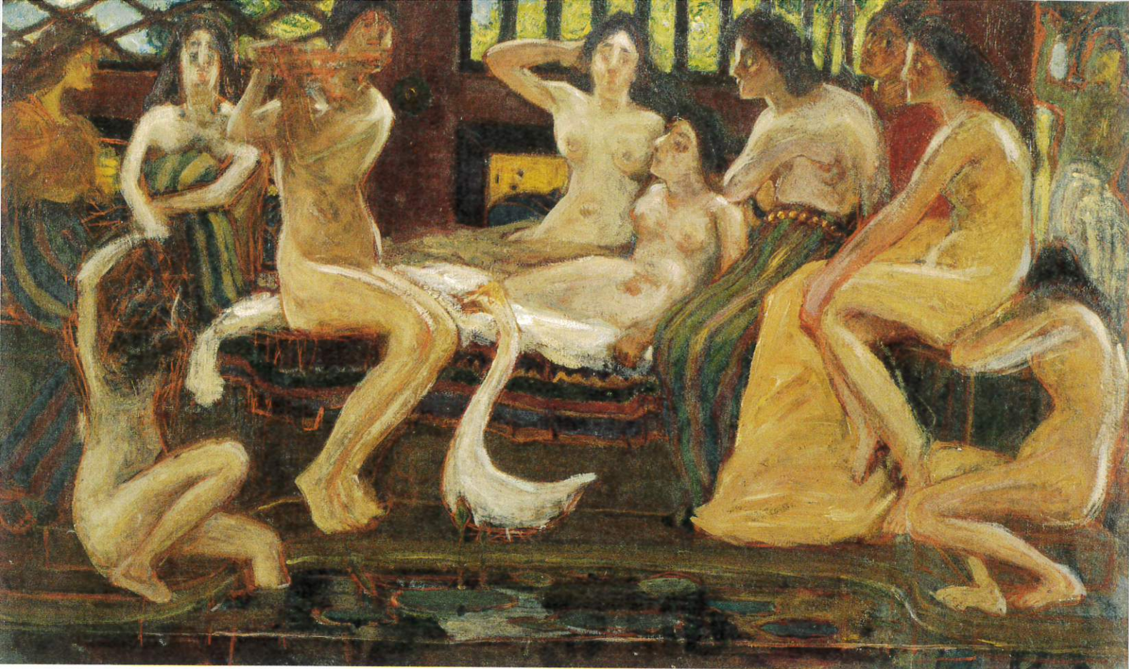
青木繁《天平時代》1904年 石橋財団ブリヂストン美術館蔵