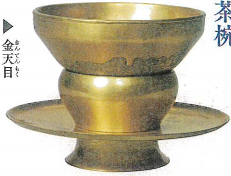
すべて醍醐寺蔵