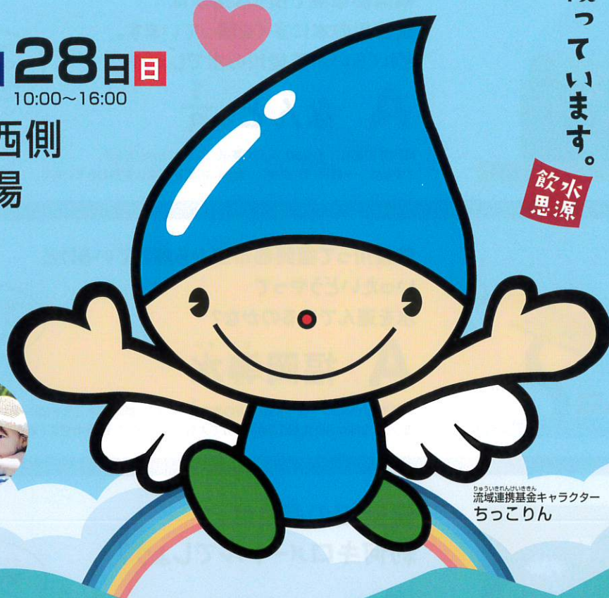
ひょういせんがいのせきん 流域連携基金キャラクター ちっこりん