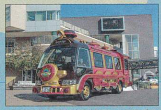
ベイサイドと東長寺を結ぶシャトルバス