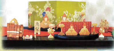
⑥ 組み木ひな 組み木工房草野