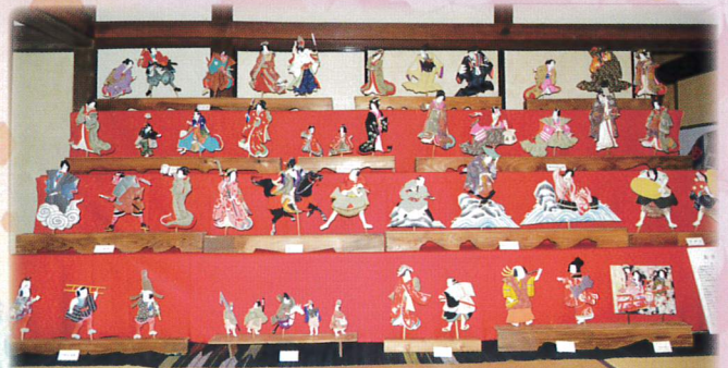
③ おきあげ雛 東・上野寛二家 公開日 2/10(土)~4/8(日)の土・日