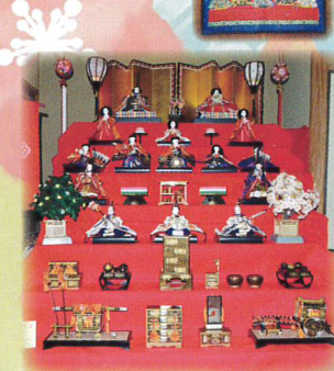
⑩ 内裏雛 井上隆敏家