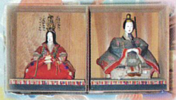
⑨ 箱雛 草野発心堂