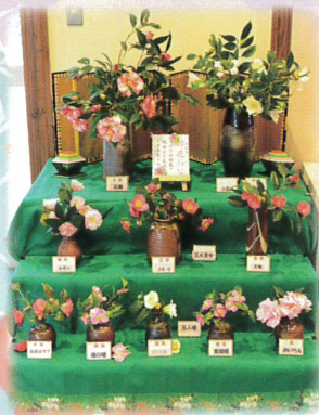
⑭ 椿花雛 (つばきひな) 世界のつばき館