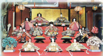
① 内裏雛 倭屋