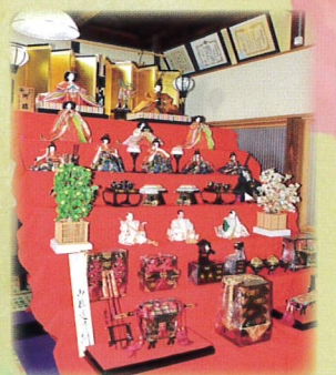
⑫ 内裏雛 食事処なかの