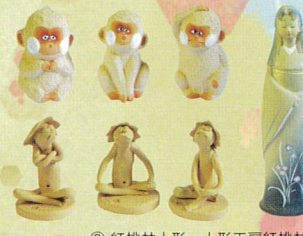
② 紅桃林人形 人形工房紅桃林