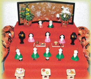
⑤ 手びねり雛 草野陶房現の証拠