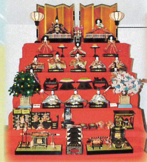
⑦ 内裏雛 ガラリー山帰来