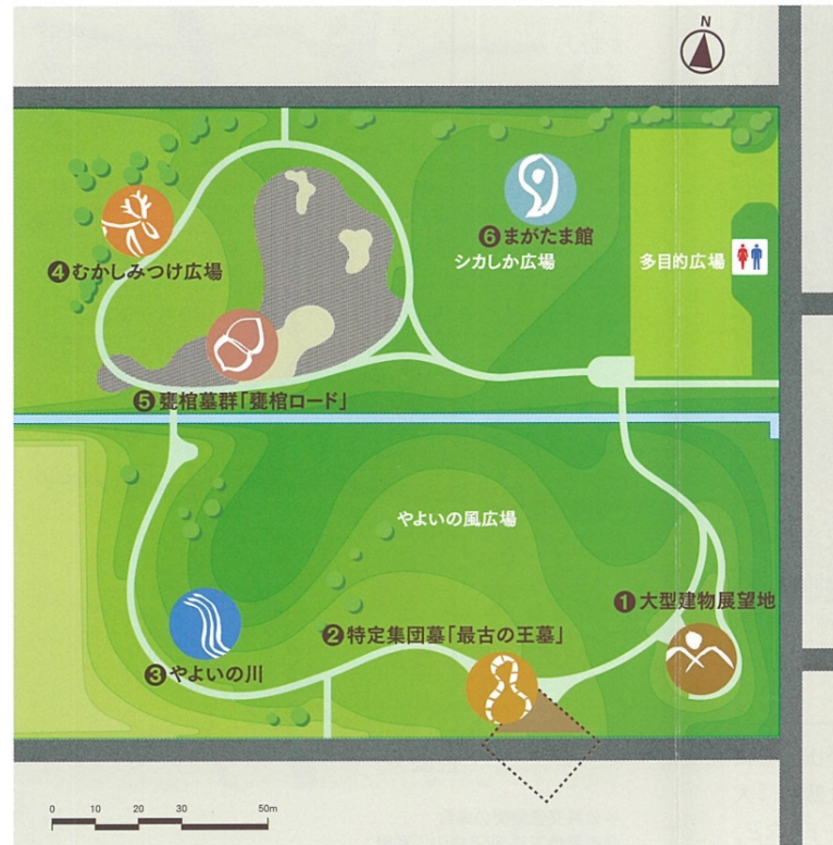
約200年にわたってつくり続けられた「甕棺ロード」