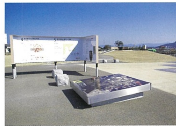
特定集団墓「最古の王墓」

Magatama-Kan (Pavilion of Curved Beads) 福岡市内外の遺跡情報、周辺文化財の回遊ルートなどを紹介します。