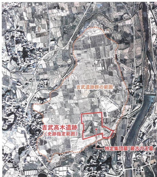
吉武高木遺跡と吉武遺跡群 (1970年代撮影航空写真)