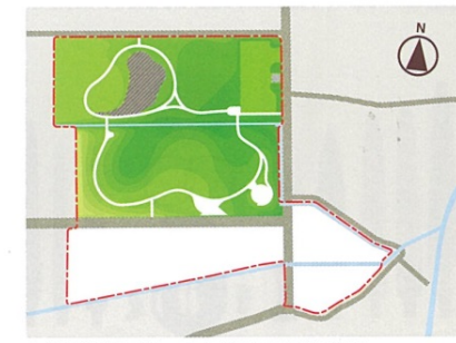
赤枠が史跡指定地。白色が今後の整備予定地。