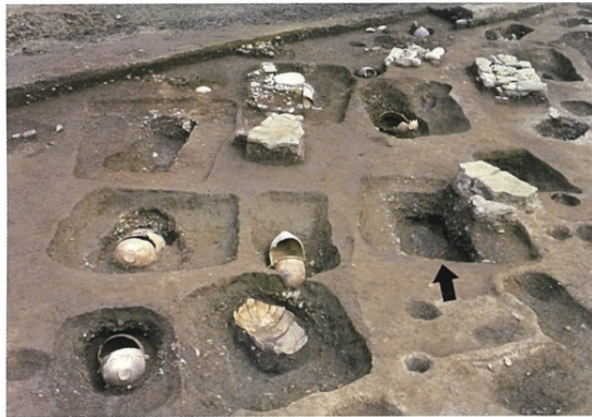
約2200年前の特定集団墓。矢印が「最古の王墓」。

公園に、「最古の王墓」「甕棺ロード」「大型建物」などの展示・解説コーナーのほか、イベントにも活用できる芝生広場・多目的広場があります。