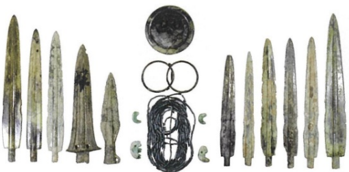
特定集団墓出土の青銅器とアクセサリー

弥生時代における国の始まりを知るうえで特に重要な遺跡として、平成5年に国の史跡に指定されました。