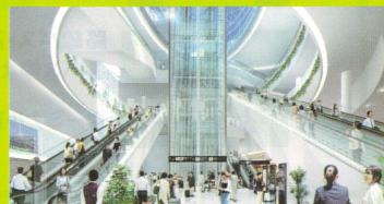
新地下鉄フロアからの吹き抜け