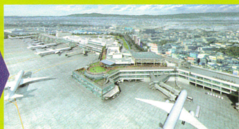
国内線旅客ターミナルビル完成イメージ