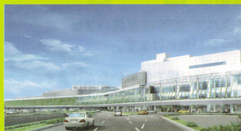
一体化されたターミナルビル